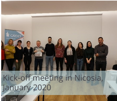
Kick-off meeting in Nicosia, January 2020