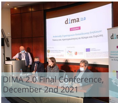
DIMA 2.0 Final Conference, December 2nd 2021