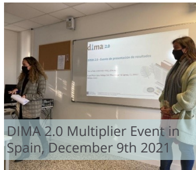
DIMA 2.0 Multiplier Event in Spain, December 9th 2021