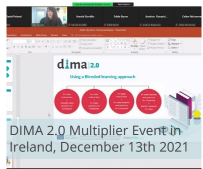
DIMA 2.0 Multiplier Event in Ireland, December 13th 2021