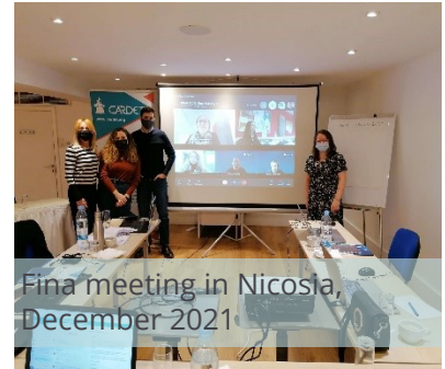
Final meeting in Nicosia, December 2021